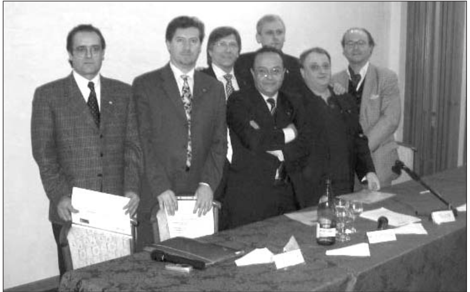
Il corpo docenti dello scorso triennio