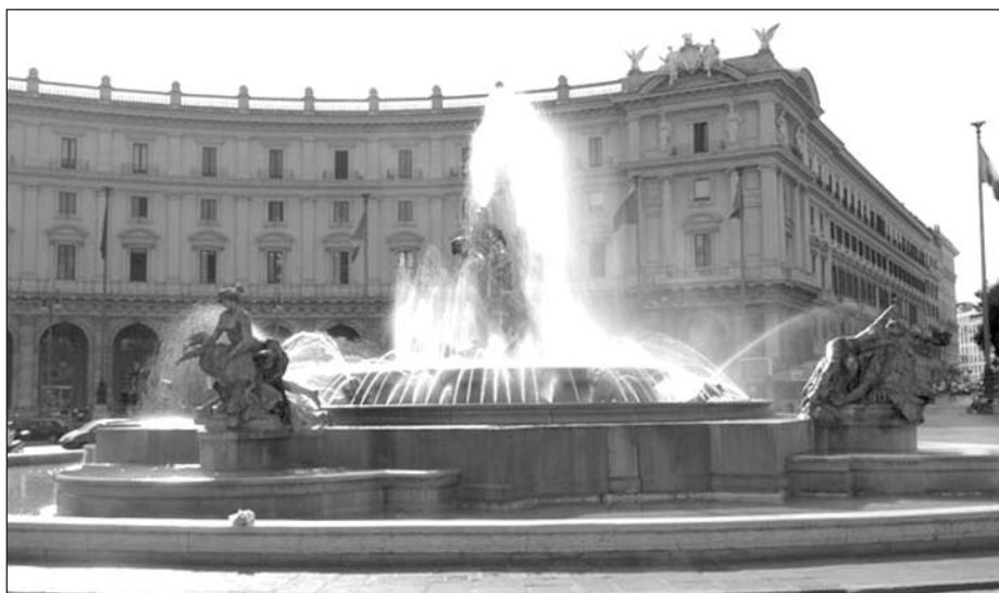
Piazza della Repubblica a Roma, dove avverrà la manifestazione di tre giorni di protesta

È necessario il rinnovo di un accordo collettivo nazionale che corregga il tiro nei confronti di una eccessiva frammentazione regionale. ■