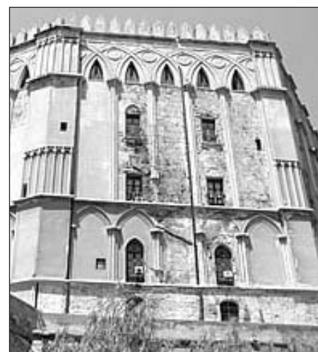
Palazzo dei Normanni a Palermo Sede dell'Assemblea Regionale Siciliana