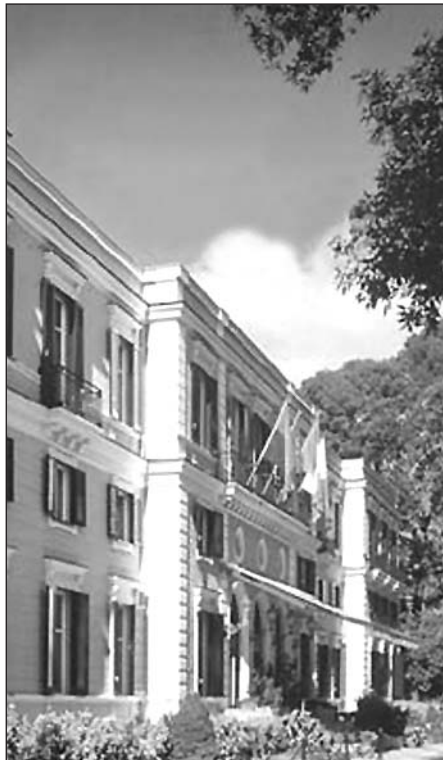
L'ingresso delle terme di Telesse (BN) sede dei corsi scuola quadri