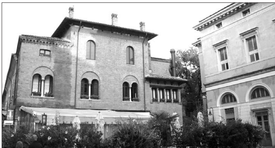
Uno scorcio di Ravenna