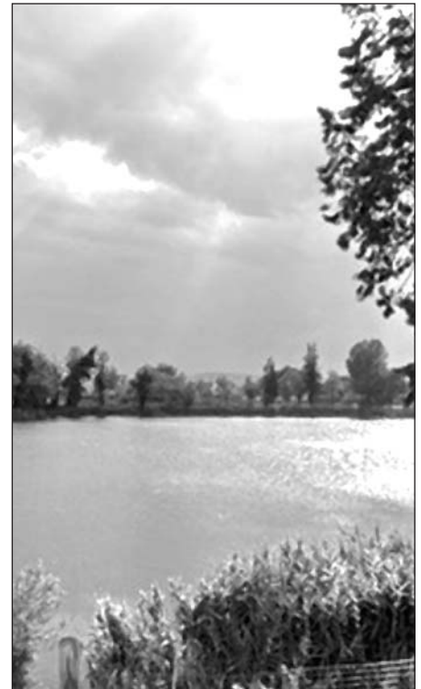
Scorcio dei dintorni di Telesse (BN) sede dei corsi scuola quadri